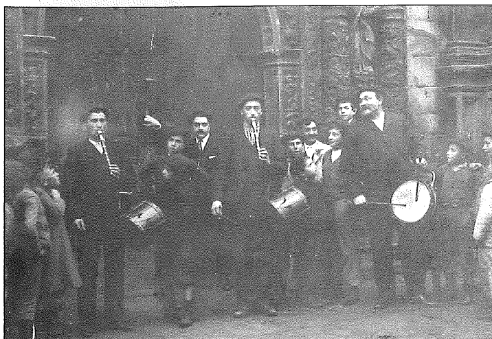
Argazki honeittan dauzenak, bakoitzen sendiak eta lagunak ezagutuko daue:

Bai bai bai bai ez ez ez ez pagia artuta dana gaztauta etxera etorri ez.